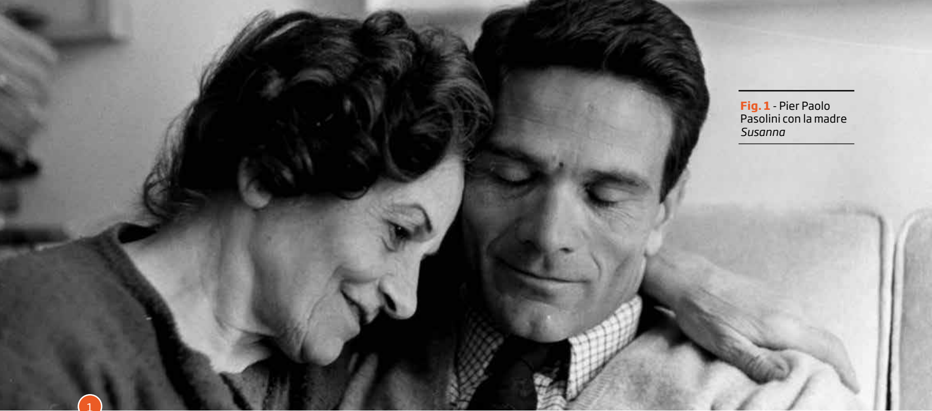
Fig. 1 - Pier Paolo Pasolini con la madre Susanna