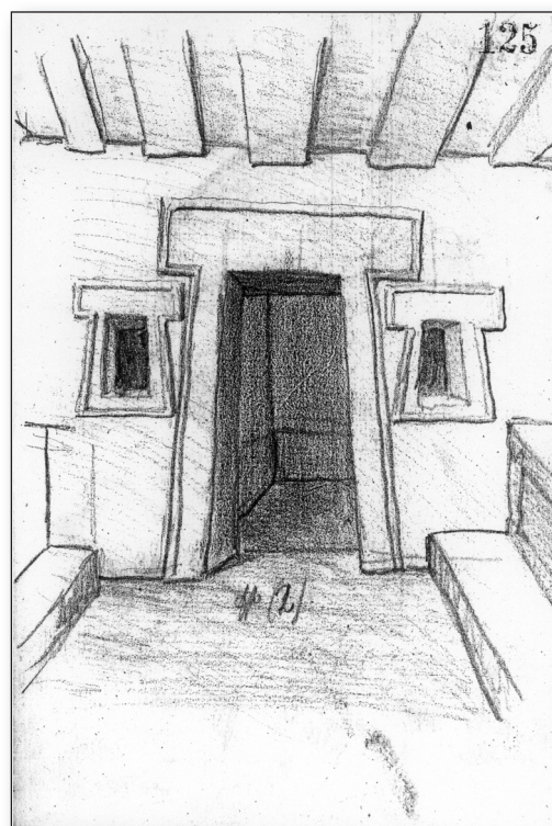
Pagine autografe dell'archeologo Luigi Rossi Danielli - Quaderni di scavo in varie località della Tuscia dal 1903 al 1908. (Biblioteca degli Ardenti Ms. A 45).