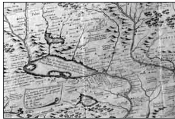
Piante del territorio della Diocesi di Pulati