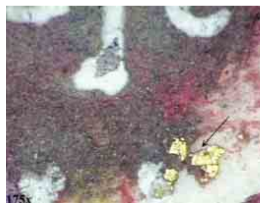
F.5 -Acquisizioni con videomicroscopio: (a) particolare della veste del santo del capolettera "F" in cui si evidenziano tracce di doratura in polvere. (b) Particolare del basilisco alla base del capolettera "I" in cui si scopre la presenza di tracce di lamina d'oro. I particolari descritti sono indicati con delle frecce.

In conclusione ci si augura che in futuro sia possibile effettuare ulteriori approfondimenti sulla Bibbia, utilizzando se possibile una strumentazione