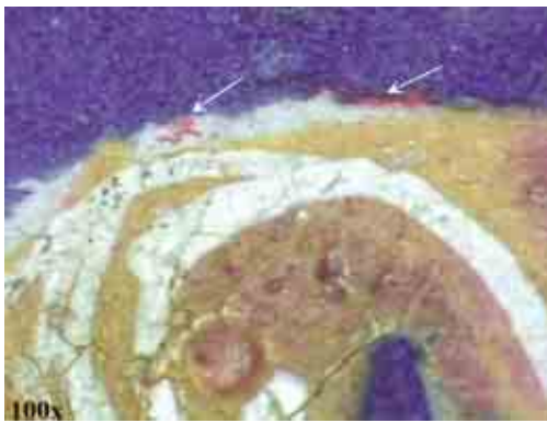
F.2 Due particolari del capolettera "F" acquisiti con videomicroscopio nei quali si evidenzia il disegno preparatorio rosso, indicato in figura dalle frecce.