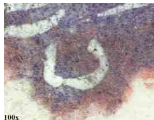
F.4 -Acquisizioni con videomicroscopio. (a) Particolare del capolettera "F" in cui si evidenzia la mescolanza tra verde e azzurro rendendo un colore verdastro per l'incarnato del volto. (b) Particolare del basilisco alla base del capolettera "I" in cui sono presenti velature di azzurro e bianco sul rosso di base.