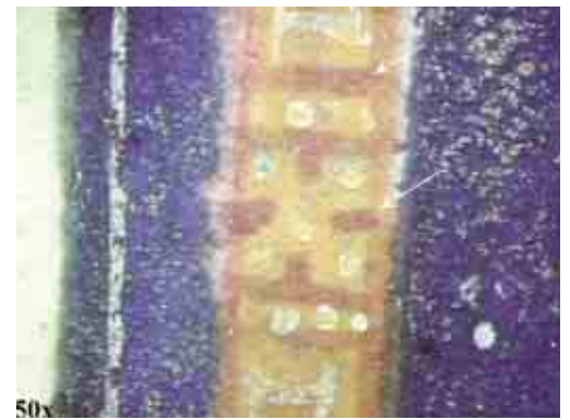
F.3 Due particolari del capolettera "F" acquisiti con videomicroscopio nei quali si evidenzia l'uso di pennellate rosse, evidenziate dalle frecce in figura, applicate sul giallo: (a) le pennellate rosse rendono il chiaroscurale degli elementi architettonici; (b) le linee rosse permettono di evidenziare le zone in ombra del volto. L'aureola viene realizzata lasciando scoperto il fondo rosso.

Nei punti in cui è più trasparente, l'apparenza è quella di una mescolanza di colori con una tonalità violacea. L'analisi ravvicinata tramite videomicroscopio ha permesso anche di sco-