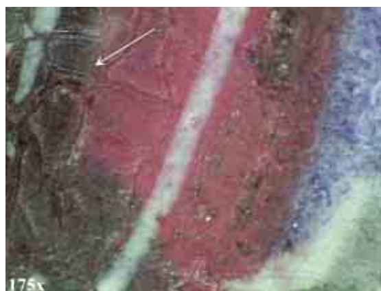
F.7 - Cretto "a pelle di coccodrillo" riscontrato alla base della lettera "F" della Bibbia, indicato in figura con una freccia bianca.

Indagini diagnostiche non invasive per la caratterizzazione dei pigmenti e delle tecniche di esecuzione nella "Bibbia cosiddetta di S. Tommaso"