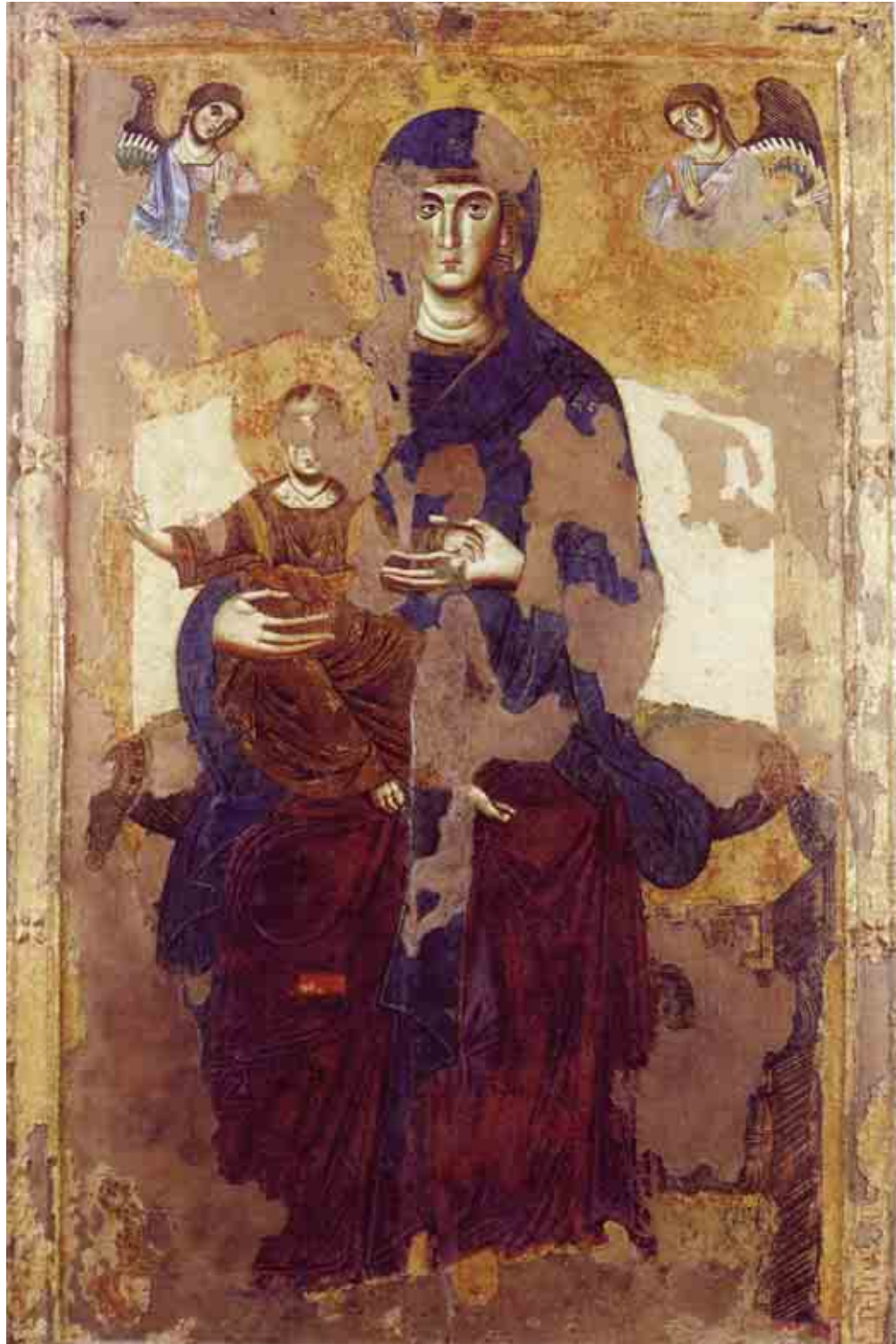
F.5 "Madonna con Bambino" Anonimo (XIII sec.) - Viterbo, Museo Civico (già in Santa Maria in Gradi).

Il che non ne sminuisce il valore, ma anzi ci permette di considerarlo contemporaneamente un raro codice e una preziosa reliquia.