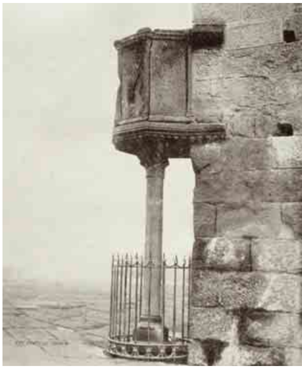
F.4 Viterbo, Santa Maria Nova, pulpito di San Tommaso (XIII sec.).

sicuramente contemporaneamente alla compilazione del codice. I fascicoli non sono composti tutti dallo stesso numero di fogli: vanno da un minimo di otto ad un massimo di sedici fogli, tutti di pergamena finemente preparata e levigata.