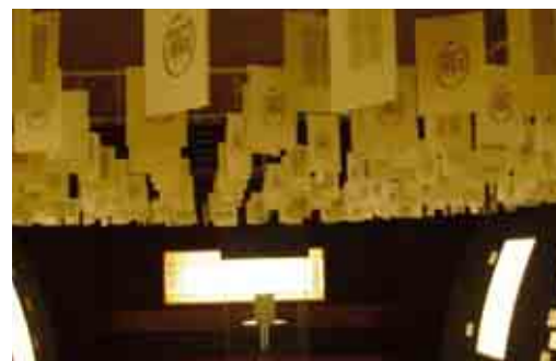
F.2 “Glossa”: interno espositivo pagine

Le fotografie retroilluminate relative ai testi sono disposte negli interspazi tra i pannelli direttamente negli espositori. Il collegamento del testo all’immagine è dato da rimandi curvilinei a sequenza puntiforme che uniscono la parola alla foto (F.5).