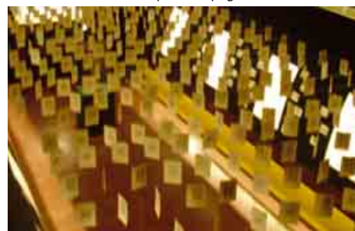
F.3 “Glossa”: interno espositivo angolazione dall’alto