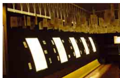
F.4 “Glossa”: interno espositivo sinistra