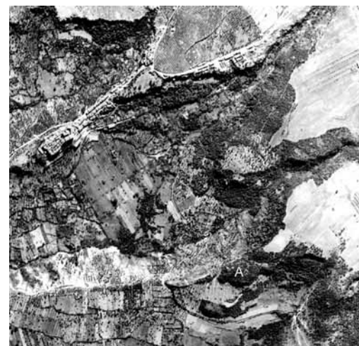
Fig. 1. Fotografia aerea dell’Istituto Geografico Militare (1954) in cui compaiono Bomarzo ed il promontorio della Castelluzza (A) (Aerofototeca Nazionale, strisciata 27, foto 430).

data, e soprattutto un’epigrafe tardo-etrusca non vista dal Vittori, di incerta lettura, nella quale si è proposto di leggere la formula onomastica di un lautni , cioè di un personaggio di rango inferiore assimilabile ad un liberto: Av(le) Nuθ T(itēs) l(autni) 6 . Nel 2006, infine, l’appassionata attività di esplorazione del territorio dell’Etruria meridionale interna condotta dall’associazione Archeotuscia ha consentito di individuare il secondo testo latino letto nell’Ottocento dall’erudito bomarzesse, offrendo così un nuovo importante elemento per la conoscenza complessiva della tagliata viaria su cui è inciso e per l’interpretazione stessa delle iscrizioni già note 7 .