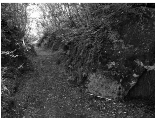
Fig. 6. Il tratto meridionale della strada lungo il promontorio della Castelluzza; in basso a destra l'iscrizione individuata nel 2006.

no mediante un'altra tagliata profondamente scavata nella roccia (fig. 2, D); oggi risulta in parte interrata ed abbandonata dalla campestre moderna, che le passa alcuni metri più ad ovest ed è tangente alla sua estremità settentrio-