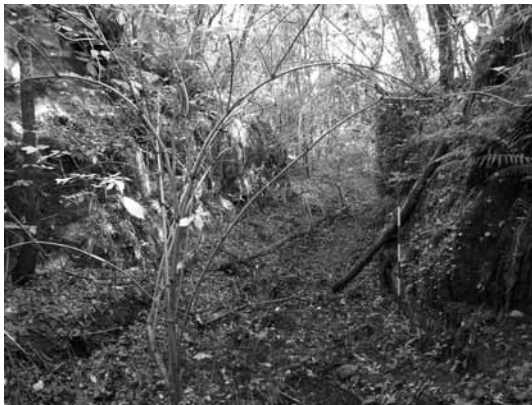
Fig. 4. Il segmento centro-settentrionale della strada tagliata nella roccia.