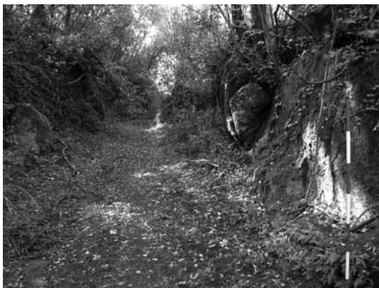
Fig. 5. Il tratto centro-meridionale del tracciato.