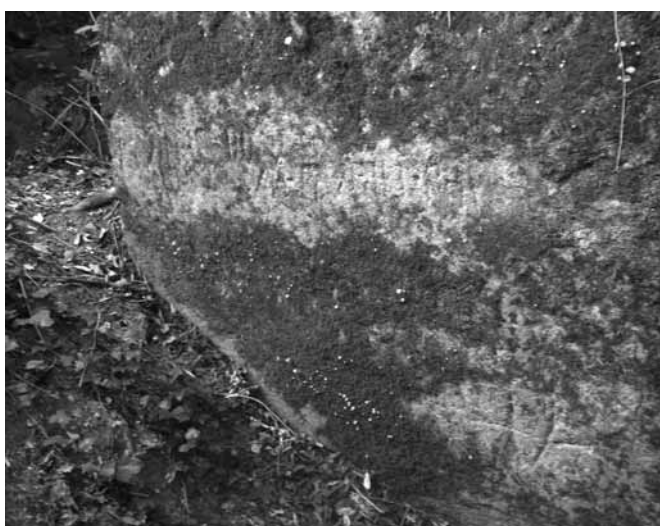
Fig. 12. Particolare dell'iscrizione latina individuata nel 2000.

te L. Servilius : teoricamente è possibile una loro interpretazione sia come p(edes) che come p(assus) 45 .