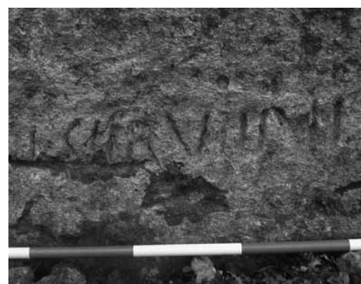
Fig. 8. Particolare dell'iscrizione latina individuata nel 2006.

(in questo punto alta m 3,25) che si è staccata ed è scivolata in basso; in origine doveva trovarsi almeno a 70 cm di altezza dall'attuale piano, a sua volta più alto di quello antico, coperto da un interro. L'epigrafe è costituita da una sola linea, lunga circa 60 cm; come le altre scritte sulla tagliata, è incisa in un campo aperto (rozzamente liscio) e le lettere, alte cm 9-10 e prive di apicature, presentano un solco a U largo cm 1 (fig. 8). Il cattivo stato di conservazione della scritta, interessata da un'accentuata erosione della superficie rocciosa e con un solco successivo alla sua realizzazione che interessa la parte inferiore delle prime cinque lettere, ne rende difficile la lettura. Il Vittori nell'Ottocento propose la trascrizione L. Sil. Rufini , interpretata come la formula onomastica trimembre di un L.