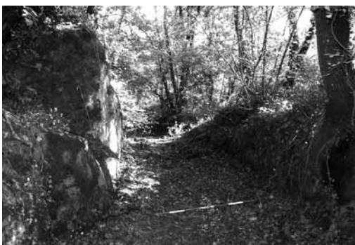
Fig. 3. Particolare del tratto settentrionale della strada lungo il promontorio della Castelluzza

una campestre, non riportata sulle carte topografiche; il tracciato si staccava dalla via Ferentensis 8 , che collegava Ferentium e la città che sorgeva sulla collina di Piammiano 9 , e si dirigeva verso l'Agro Falisco e Falerii Novi. Dalla valle del Veza la strada saliva