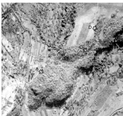
Fig. 2. Il promontorio della Castelluzza in un particolare di una ripresa aerea della Royal Air Force scattata nel 1944.