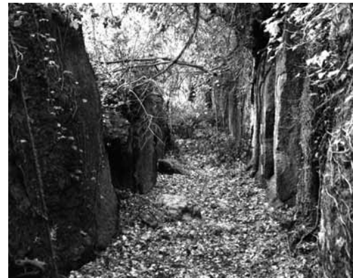
Fig. 7. Il segmento più meridionale della via cava della Castelluzza.

L'iscrizione individuata nel 2006 si trova a 30 cm dal piano di campagna, su una porzione della parete rocciosa