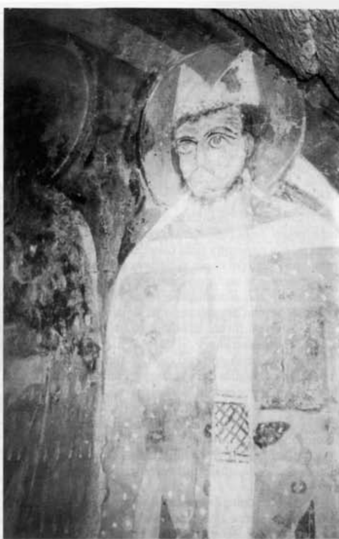
Cattedrale di Civita Castellana - Oratorio del Cuor di Maria S. Tommaso Becket