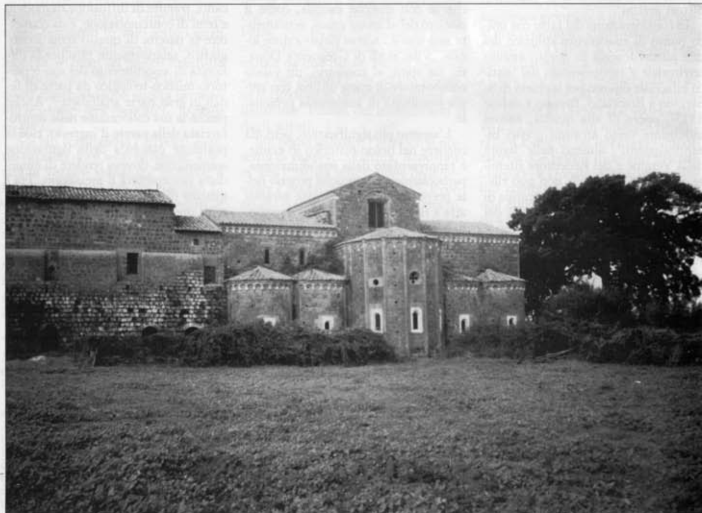
Falleri (Faleri - Fraz. Fabrica di Roma)

3 La carriera ecclesiastica e politica di Thomas Becket passa essenzialmente per queste fasi: arcidiacono di Canterbury nel 1154, Can—