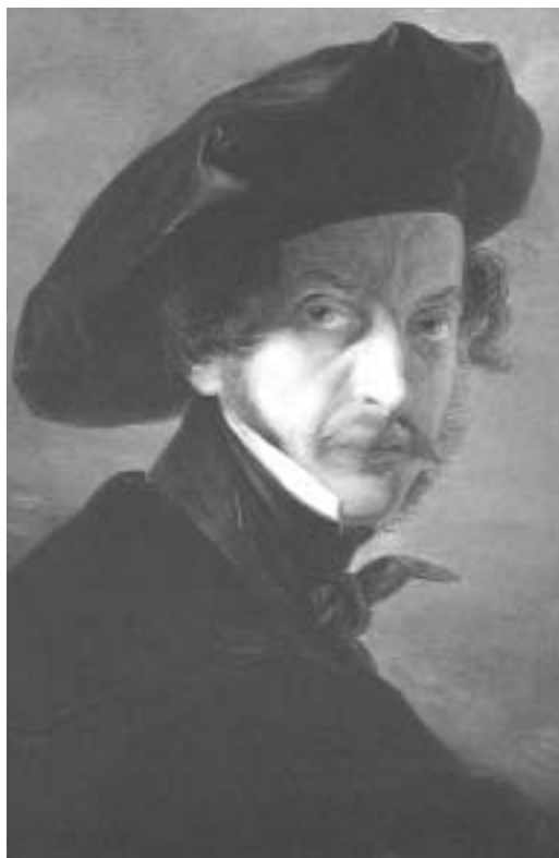
Autoritratto, olio su tela (cm. 50,5 x 43,5) Torino, collezione privata.

rino hanno stesa quella patina medesima che colorisce così robustamente le rocce che lo sostengono, e che mal si distinguono da loro” 8 , e più avanti, sicuramente esagerando, completa la scena con cadenzato piglio negativo: “...non c'era in paese né osteria, né bettola, né case, né quartieri, né camere a pigione nemmeno per ombra. Quel ch'è peggio, né un macello né un pizzicagnolo. Appena un fornaio