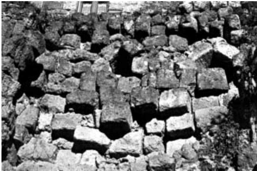
Fig. 5 - Particolate del paramento a sinistra della porta S. Maria di Civita di Bagnoregio.

sato a due torri piene aggettanti, che appoggia direttamente sugli strati di abbandono di una casa romana. Dai recenti scavi diretti dalla prof. Maetzke è stata suggerita una datazione agli ultimi decenni del VI secolo e associato agli eventi che hanno avuto luogo sul confine longobardo-bizantino.